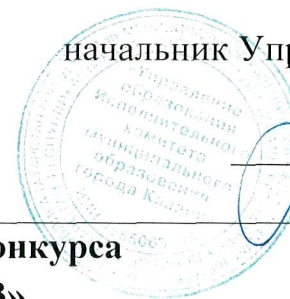
График проведения городского этапа конкурса «Учитель года города Казани-2023»